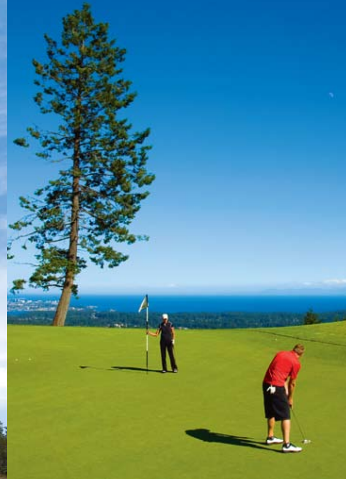
BY/PAR JAMES McCARTEN