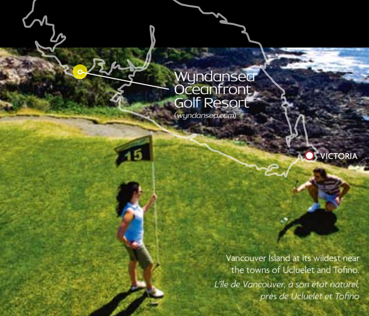
Wyndanseas Oceanfront Golf Resort (wyndanseas.com)